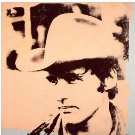
Andy Warhol (1928-1987) Dennis Hopper , 1971 Pintura de polímero sintético y serigrafía sobre lienzo, 101,6 x 101,6 cm Colección Mugarbi

Buen viajero que apreciaba la libertad por encima de otras cosas, la figura de Dennis Hopper parece hoy haber recorrido bellos páramos y lugares perdidos, cruzando puentes donde la ternura de la juventud se tiene que enfrentar a la violencia de una sociedad hecha para unos pocos ganadores que para no perder el equilibrio precisa realizar periódicamente rituales sacrificiales de la juventud para calmar así a sus dioses. La exposición quiere ser un homenaje del museo a un bohemio de un lejano lugar en Norteamérica llamado Dodge City.