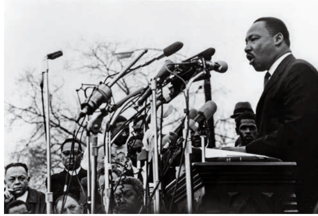
Dennis Hopper (1936-2010) Martin Luther King, Jr. Alabama, 1965 Gelatina de bromuro de plata, 40,6 x 61 cm