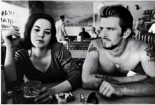
Dennis Hopper (1936-2010) Pareja de motoristas, 1961 Gelatina de bromuro de plata, 40,6 x 61 cm