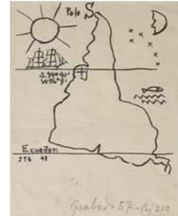
Joaquín Torres-García (1874-1949) América invertida , 1943 Tinta sobre papel, 22 x 16 cm Museo Torres-García, Montevideo

Representó la ciudad caótica en una serie de sorprendentes collages, en los que la publicidad está yuxtapuesta con el paisaje y la aspiración de una “visión total” está plasmada en vistas aéreas de la metrópolis. Aunque expuso en Nueva York y eventualmente vendió obras, Torres-García se fue desencantando