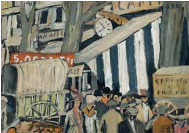
Joaquín Torres-García (1874-1949) Entoldado (La feria) , 1917 Óleo sobre lienzo, 51 x 72,5 cm Colección particular

Nacido en Montevideo (Uruguay, 1874-1949) vivió en varias metrópolis europeas y americanas, entre otras en Barcelona, Nueva York, París y Madrid. De carácter inquieto y de vocación migrante, esta condición lo ayudó a entender y teorizar sobre la dimensión transnacional del arte moderno. Es la suya una concepción que admite combinar varios estilos que en una primera lectura pudieran parecer contradictorios. Concibiendo la abstracción como un medio, y no como un fin, Torres-García sostenía que el arte podía ser abstracto o concreto (término que él empleaba para indicar “figurativo”), ya que sus elementos constitutivos son siempre los mismos, independientemente de que con ellos se pretenda representar la realidad sensible o no. Consciente del carácter temporal y circunstancial de los movimientos artísticos, Torres-García basó la invención de su estilo distintivo, el Universalismo constructivo, en formas arcaicas anteriores a las convenciones artísticas tradicionales del arte occidental. Su fascinación por un pasado inalcanzable se expresaba asimismo en su preferencia por seleccionar materiales elementales, acabados rústicos y estructuras precarias. De este modo no cesó de proponer una modernidad arcádica, ni de aspirar a ser un moderno en la Arcadia.