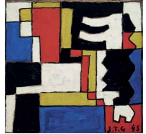
Joaquín Torres-García (1874-1949) Estructura a cinco tonos con dos formas intercaladas , 1948 Óleo sobre cartón, 50 x 52 cm Colección particular. Cortesía Galería Sur, Montevideo

progresivamente del nuevo mundo y regresó finalmente con su familia a Europa en 1922, donde vivieron en Italia y en el sur de Francia antes de establecerse en París en 1926.