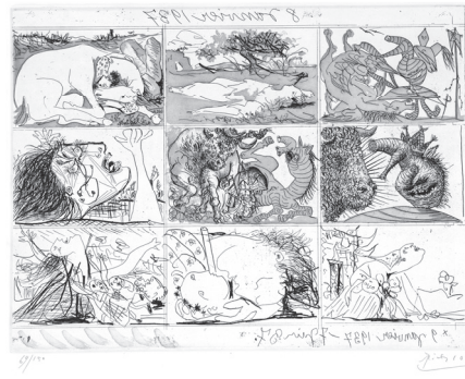
Pablo Picasso Sueño y mentira de Franco 8 y 9 enero y 7 junio 1937 Aguafuertes con aguatinta al azúcar 31,5 x 42 cm Museo Picasso Málaga

Esta exposición continúa la saga de muestras dedicadas a analizar en profundidad obras que forman parte de la colección permanente del Museo Picasso Málaga. De este modo se contribuye a difundir aspectos de la gran diversidad estética del artista. Sueño y mentira de Franco es el punto de partida de Viñetas en el frente , que muestra tanto las planchas de cobre originales, junto a dos juegos de estampas pertenecientes a tiradas diferentes: dos aguafuertes sobre papel China pegado sobre papel Japón (firmadas y numeradas del 1 al 150) y dos aguafuertes sobre papel verjurado Montval (firmadas mediante sello entintado en gris y numeradas del 1 al 850). Este par de grabados fueron finalmente editados por iniciativa de Picasso junto a un texto escrito por él mismo, y todo en un portafolio con el título manuscrito, reproducido en facsímil y pegado en la portada. Los fondos obtenidos con la venta de los ejemplares se destinaron a la causa republicana.